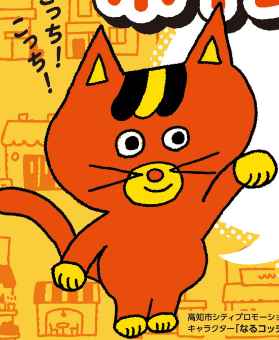
高知市シティブロモーション キャラクター「なるこっちー」

高知市の加盟店で ジモッペイを使った お支払いをすると お得にお買い物 できるよ!!