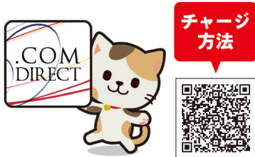
高知信用金庫ドットコムダイレクト